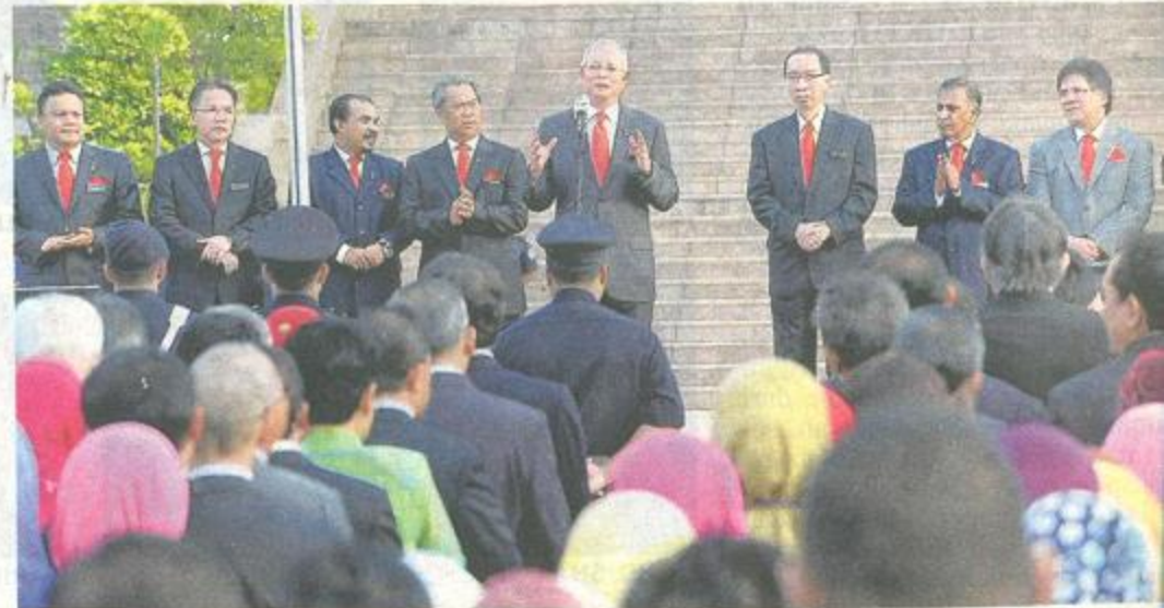
NAJIB menyampaikan ucapan kepada penjawat awam pada Perhimpunan Bulanan Jabatan Perdana Menteri di Dataran Perdana Putra, Putrajaya semalam.

Menurut beliau, pertumbuhan baik ekonomi negara yang berterusan menuntut kepada pengurusan yang baik agar dapat memastikan bahawa kekayaan negara diagih kepada seluruh rakyat berasaskan kepada keadilan sosial. - Bernama